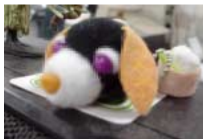
熱いまなざしを注ぐファンの方。

今回のライブについて尋ねたところ「体調管理が大変でした。終わったらアイスを食べたい」と、まるでボクサーのようにライブに向けてスティックに体作りに励んできたことを激白し